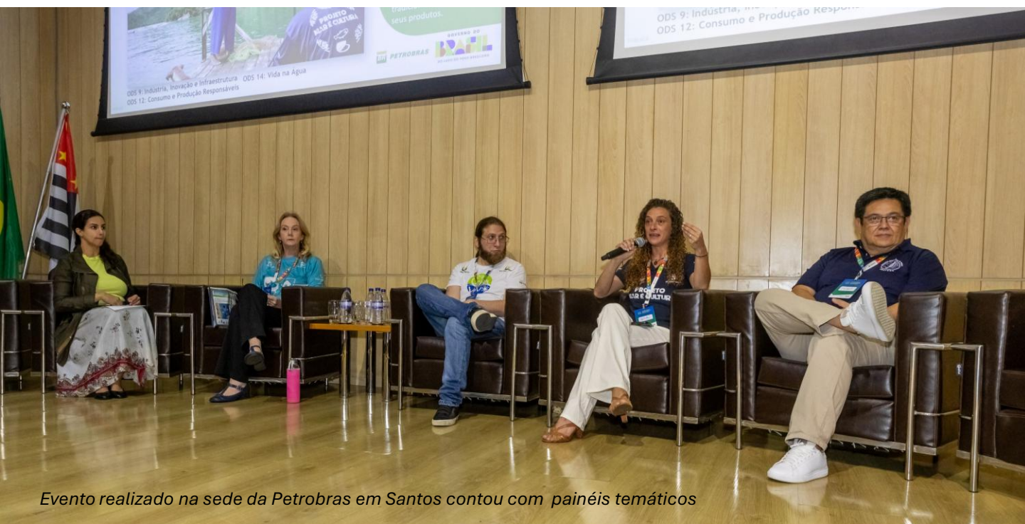
Evento realizado na sede da Petrobras em Santos contou com painéis temáticos